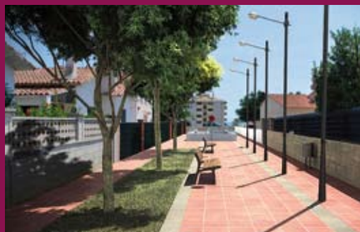
Inversió al barri de La Isla