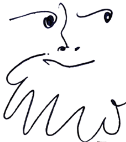
Picasso. Fetó cap barbat ambint, 1966. Olivierio Toschi Picasso. VEGAP, Madrid, 2012