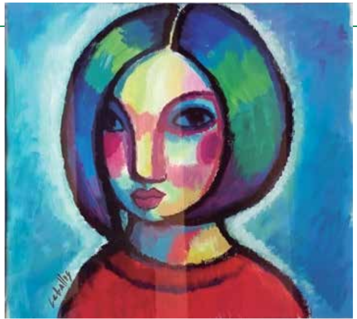
“Mirada blava”, 2015. Obra de Martí Ceballos cedida a l’Ajuntament de Caldes d’Estrac

Com és habitual en Ceballos, la majoria dels quadres exposats s’inspiraven en la naturalesa, tot i que en alguns la figura, i en especial el rostre femení, tenien un protagonisme especial. En definitiva, una pintura no convencional que cerca la manera d’expressar les emocions a través del color i el moviment de cada superfície.