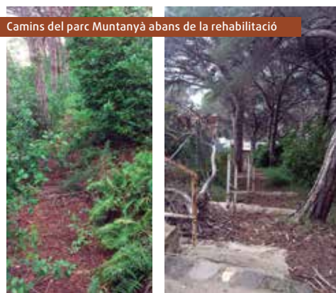
Camins del parc Muntanyà abans de la rehabilitació

Un cop finalitzada la primera part del programa, l'Ajuntament de Caldes contractarà un dels joves que hi ha participat i que treballarà sota la coordinació de Campeny durant un període de 3 mesos.