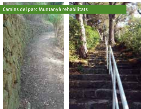
Camins del parc Muntanyà rehabilitats